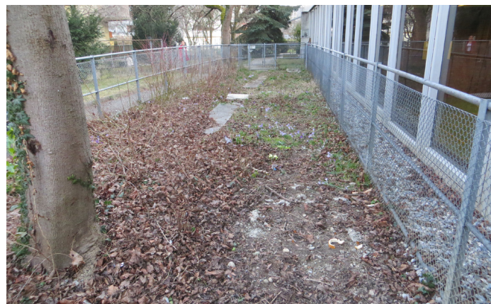
Le jardin de l'école des Charmilles, avant...

Nous espérons pouvoir vous montrer ces films prochainement et vous en tiendrons informés.