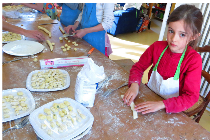
Confection de gnocchis aux Coloriés