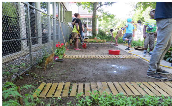
.... et maintenant.