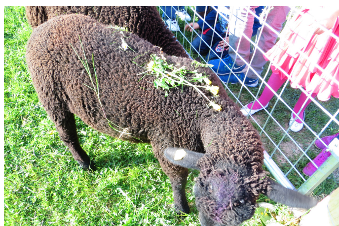
Les moutons noirs de la ferme de Budé