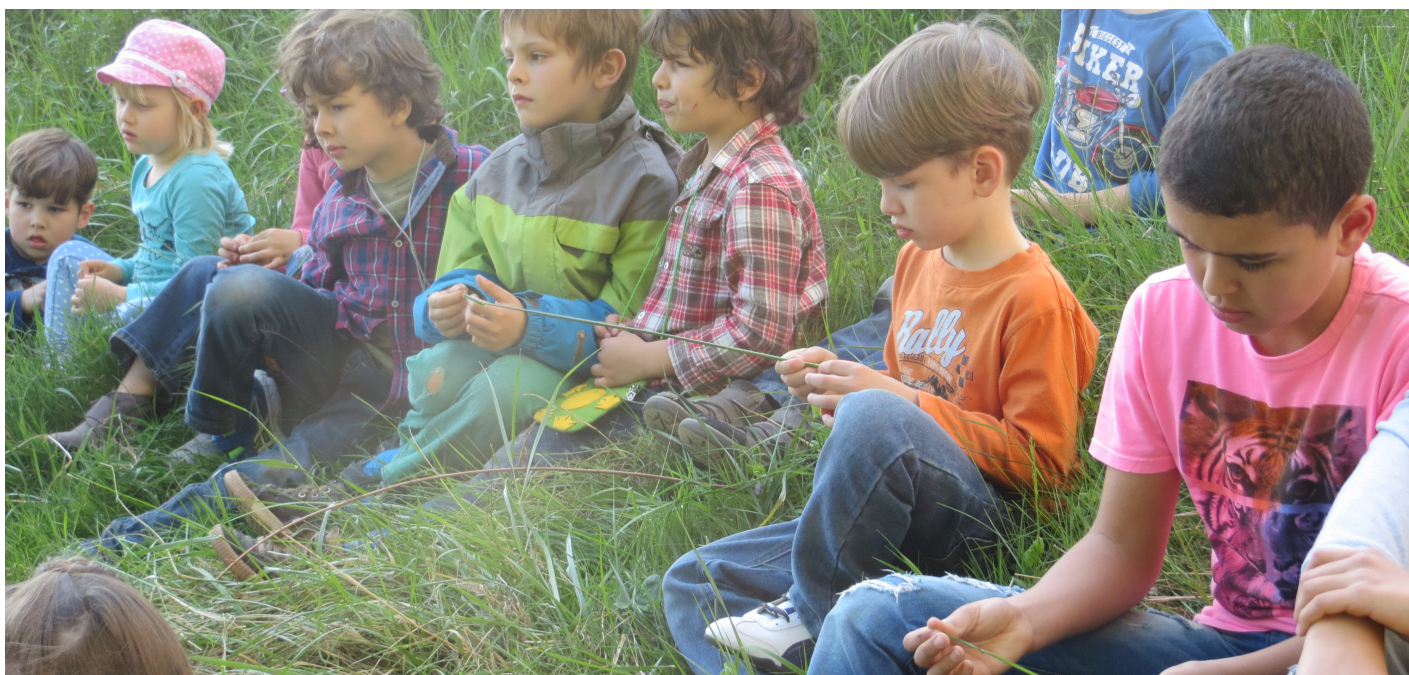
Présentation à la ferme de Budé

Enfin samedi, un groupe d'enfants et parents sont partis à la découverte de la nature en ville au Parc Geisendorf avec Pro Natura.